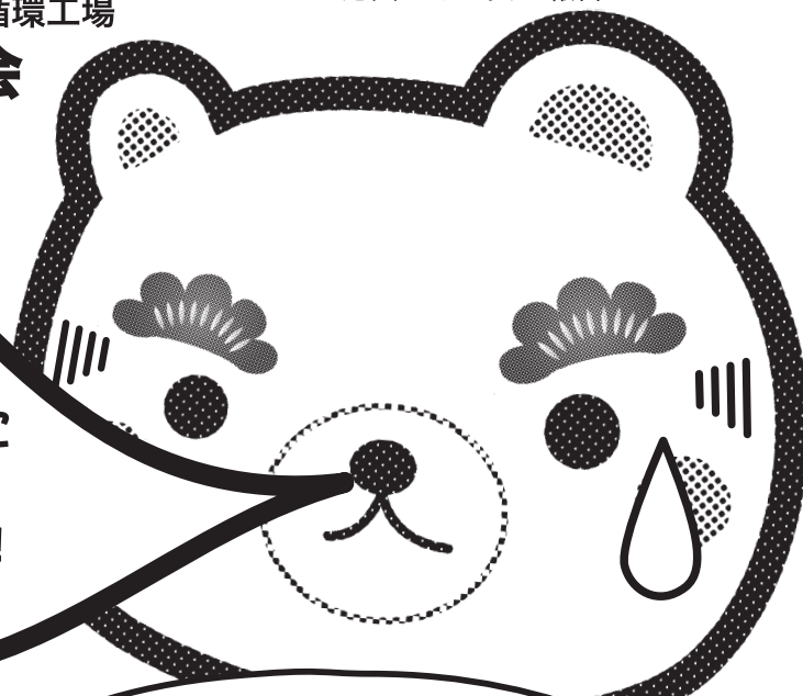
松葉調査ゆるキャラ 松くまちゃん